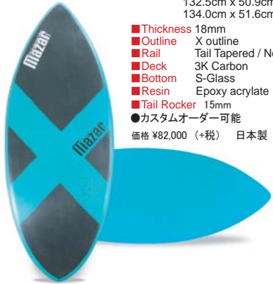
X-CB1 color variation